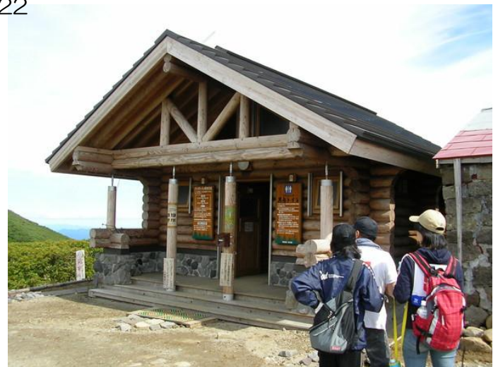
黒岳石室バイオトイレ(2003年9月運用開始)