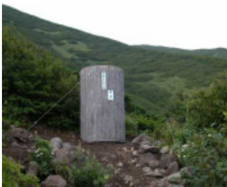
プラスチック樹脂製の携帯トイレブース