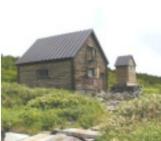
ヒサゴ沼避難小屋とトイレ