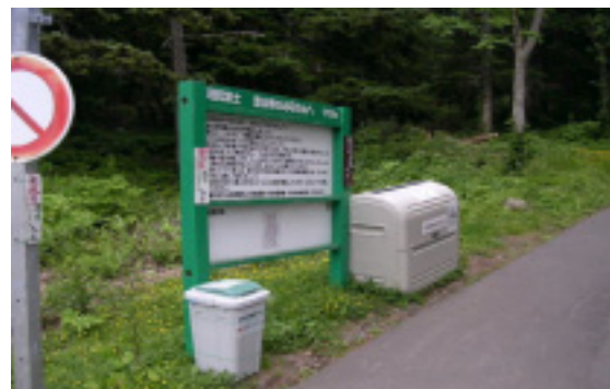
携帯トイレ回収ボックスは、鴛泊コース、沓形コースの両コース登山口にある。