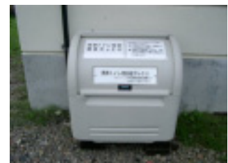
携帯トイレ回収ボックス