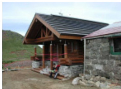
黒岳バイオトイレ(右は石室)